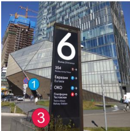
Схема заезда/парковки около башни «ОКО»

Парковка около башни «ОКО» платная: 1 час – 350 руб./час.